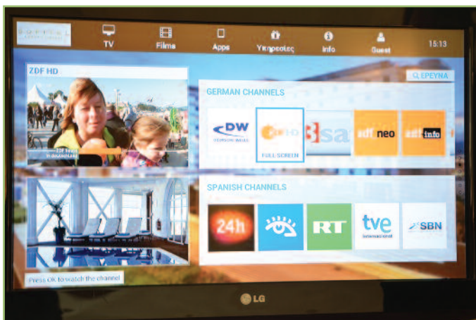
9 Το σύστημα IPTV του Sofitel παρέχει άριστη ποιότητα εικόνας στα προγράμματα αλλά και τα μενού διαχείρισης.

Λ. Ποσειδώνος 33, Άλιμος, τηλ.: 210-9852935, www.idcoms.gr, info@idcoms.gr