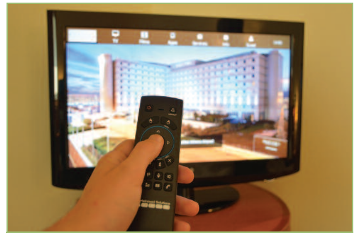
10 Μέσα από το σύστημα του Sofitel είδαμε να ξεδιπλώνονται για πρώτη φορά οι αληθινές δυνατότητες του IPTV.