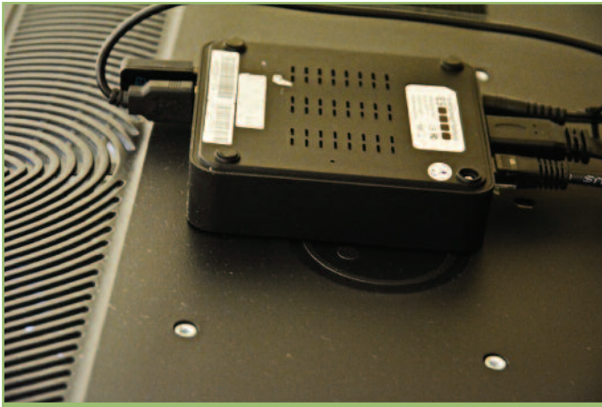
4 Κάθε τηλεόραση είναι εξοπλισμένη με το STB του συστήματος της ES που βασίζεται σε λογισμικό Android.