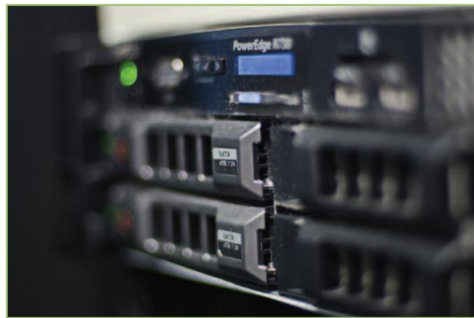
2 Ο Server της Entertainment Solutions με τις συστοιχίες δίσκων HDD είναι η καρδιά του συστήματος.