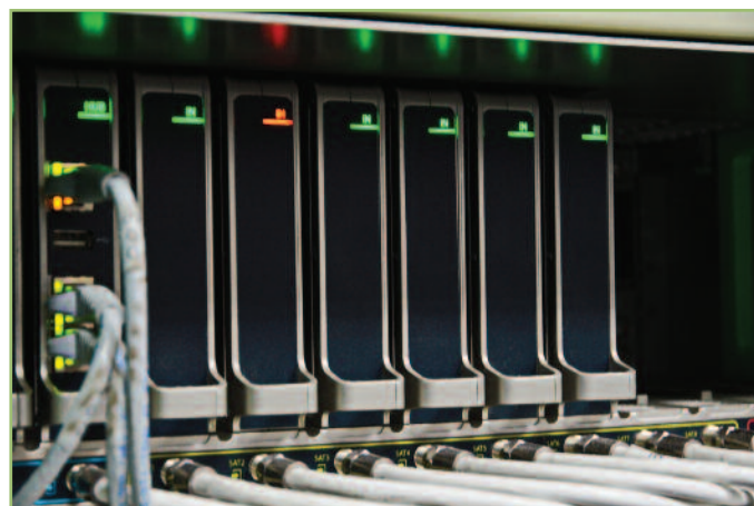
3 Το IKUSI Flow αναλαμβάνει να τροφοδοτήσει το σύστημα με 79 υπηρεσίες σε IP Streams.

Την απαισιόδοξη αυτή ματιά ήρθε να αλλάξει 180 μοίρες η επίσκεψή μας στο ξενοδοχείο Sofitel, δίπλα στον Διεθνή Αερολιμένα Αθηνών, όπου πήγαμε με σκοπό να γνωρίσουμε τις δυνατότητες του νέου συστήματος IPTV, που πραγματοποιήθηκε από την εταιρία IDComs. Η εφαρμογή βασίζεται στον συνδυασμό του συστήματος της Entertainment Solutions και του headend IKUSI Flow (εικόνα 1). Το τελικό αποτέλεσμα είναι ένα πανέξυπνο σύστημα IPTV και Video On Demand, που πλαισιώνεται από πληθώρα αμφίδρομων εφαρμογών και δυνατοτήτων κεντρικής διαχείρισης.