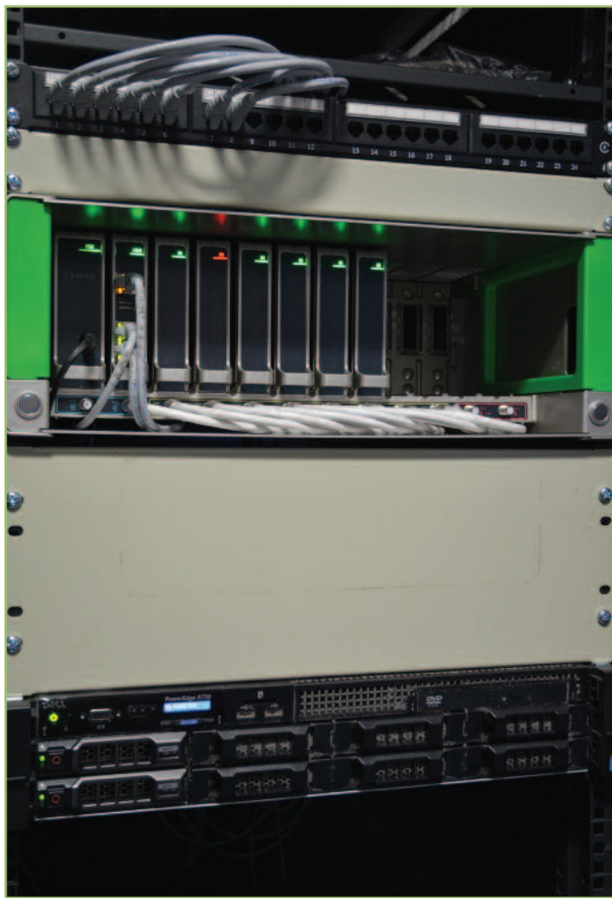
1 Το Rack του νέου συστήματος IPTV στο ξενοδοχείο Sofitel, δίπλα στον Διεθνή Αερολιμένα Αθηνών.