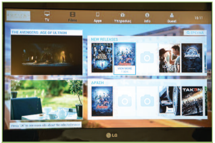
7 Οι ταινίες κατηγοριοποιούνται αυτόματα ή χειροκίνητα από τη διαχείριση και το σύστημα προβάλλει προεπισκόπηση βίντεο κατά την αναζήτηση.