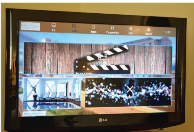
6 Τηλεόραση, ταινίες Box Office και Adult στο VoD του συστήματος IPTV του Sofitel, μαζί με υπηρεσίες, εφαρμογές και άλλα πολλά!

Ένα πολύ σημαντικό στοιχείο που θέλαμε να εξετάσουμε κατά την επίσκεψή μας στο Sofitel, ήταν η συνεργασία του συστήματος με το ξενοδοχείο. Και όταν λέμε συνεργασία, εννοούμε το «πάντρεμα» με