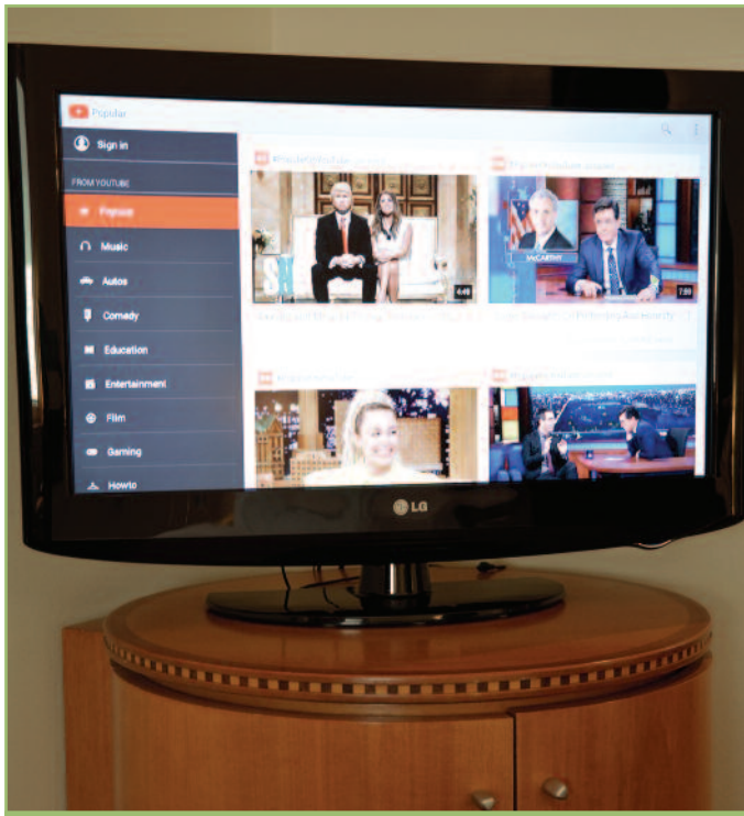
8 Βασισμένο σε Android, το STB μπορεί να τρέξει οποιαδήποτε εφαρμογή, όπως YouTube, Facebook, οδηγούς πόλης κτλ.

το λογισμικό PMS, τη λειτουργία των τηλεοράσεων με το τηλεχειριστήριο και την αξιοποίηση του υπάρχοντος δικτύου IP. Όλους αυτούς τους τομείς, το σύστημα IPTV του Sofitel τους είχε καλυμμένους. Η συνεργασία με το PMS εξασφαλίζει ότι οποιαδήποτε πληρωμή μέσω του VoD και γενικότερα της τηλεόρασης, περνάει αυτόματα στον λογαριασμό του πελάτη. Επίσης, μέσω της συνεργασίας με το PMS η τηλεόραση κάθε δωματίου προσωποποιείται, όχι μόνο για welcome μηνύματα, αλλά και στη γλώσσα, στα κανάλια που προβάλλει, τις υπηρεσίες κτλ.