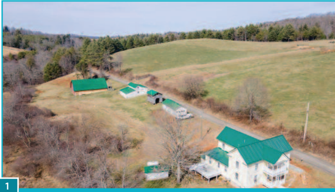
1 Η ασύρματη τεχνολογία έρχεται να δώσει λύσεις internet σε περιοχές που δεν έχει φτάσει ακόμα η ευρυζωνικότητα στις σταθερές συνδέσεις.