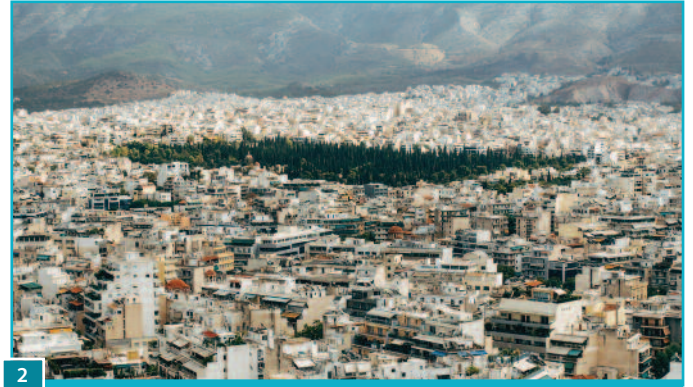
2 Οι δυσκολίες λήψης ικανοποιητικού σήματος παραμένουν και σε χαμηλούς ορόφους αστικών περιοχών με πυκνή δόμηση.

Παραμένουν, όμως, οι δυσκολίες λήψης ικανοποιητικού σήματος σε απομακρυσμένες περιοχές, αλλά και σε χαμηλούς ορόφους αστικών περιοχών με πυκνή δόμηση.