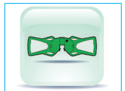
3 Το νέο ενεργό / παθητικό δίπολο.