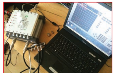
3 Test: Τα multiswitch υπό δοκιμή