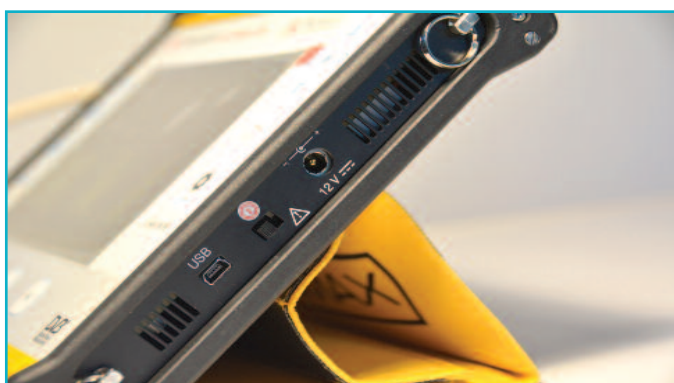
5 Σύνδεση mini USB για σύνδεση με τον υπολογιστή και αναβάθμιση λειτουργιών, όπως και διαχείριση, μέσω του NetUpdate.

Όσον αφορά τις μετρήσεις το UltraLite διαθέτει παραπάνω από τις βασικές! Ξεχωρίζουμε απευθείας το ταχύτατο Spectrum Analyser με υποστήριξη αυτόματης αναγνώρισης ψηφιακών καναλιών, δυνατότητα Max Hold, αλλαγή προβολής (transparency ή solid), αναζήτηση ανά κανάλι ή συχνότητα, επιλογή πλάνων καναλιών και εύκολη αλλαγή span / reference level. Προχωρώντας στο μενού μετρήσεων συναντάμε MER, Constellation Diagram, δοκιμή LTE και ανάλυση Dynamic Echoes.