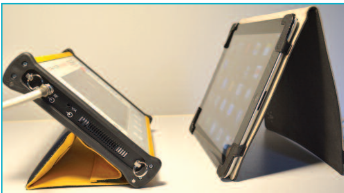
1 Το HD Ranger UltraLite της Promax δίπλα από το iPad! Το πρώτο πεδιόμετρο με τόσες δυνατότητες σε τόσο μικρές διαστάσεις.

Το UltraLite έχει τα τεχνικά χαρακτηριστικά του HD Ranger Lite, προσθέτοντας τη δυνατότητα εισόδου A/V και την αναβάθμιση των χαρακτηριστικών του μέσω θύρας USB. Φυσικά, σε σχέση με τα HD Ranger+ και HD Ranger2 έχει διαφορές, αλλά για ορισμένους χρήστες μπορεί να είναι αμελητέες. Ξεκινώντας από τα βασικότερα, υποστηρίζει ψηφιακά πρότυπα DVB-T/C/S και DVB-T2/C2/S2, όπως και αναλογική τηλεόραση. Διαθέτει οθόνη 7" με πολύ υψηλή ευκρίνεια, αλλά όχι αφής όπως στα μεγαλύτερα μοντέλα, αλλά υποστηρίζει το