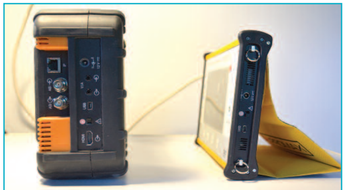
2 Μπορεί να μην έχει τις συνδέσεις του HD Ranger2 (αριστερά), όμως έχει όλες του τις δυνατότητες και ταυτόχρονα είναι εξαιρετικά μικρότερο.