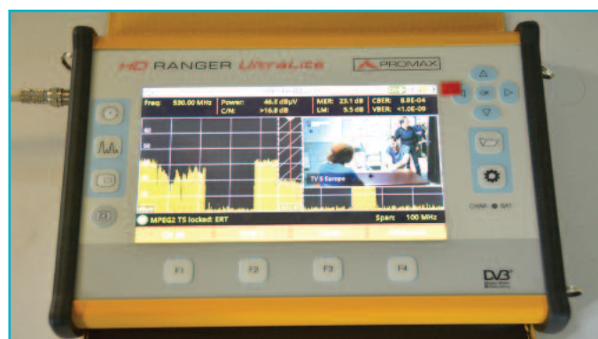
7 Ταχύτατος αναλυτής φάσματος, εικόνας σε ψηφιακά κανάλια, οθόνη 7" και λειτουργία τριπλού διαχωρισμού οθόνης σε ένα πεδιόμετρο μεγέθους tablet!

Υποκατάστημα Αθηνών: Συγγρού 229, τηλ.: 210-9373008, fax: 210-9373009, e-mail: account.ath@msselectronics.gr.