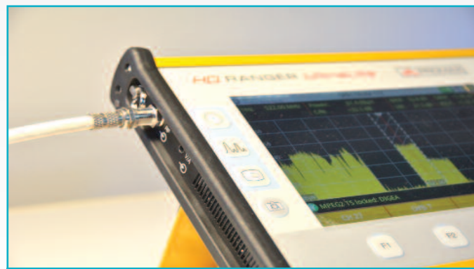
4 Πολύ σημαντική η είσοδος A/V για ένα όργανο πεδίου, όπως για τον έλεγχο εικόνας από κάμερα CCTV.

πρακτικότερο και κορυφαίο χαρακτηριστικό Triple Split Display με δυνατότητα ταυτόχρονης προβολής εικόνας, φάσματος και μετρήσεων (εικόνα 7). Στις συνδέσεις υστερεί σημαντικά σε σχέση με το HD Ranger2, αλλά γενικά δεν θα λέγαμε ότι το UltraLite είναι «ελλιπές», απλά το HD Ranger2 είναι υπερ-πληρέστατο.