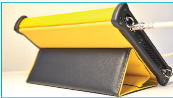
3 Το κάλυμμα της πρόσοψης διαθέτει μαγνήτη και αναδιπλώνεται για να λειτουργήσει και ως βάση στήριξης.